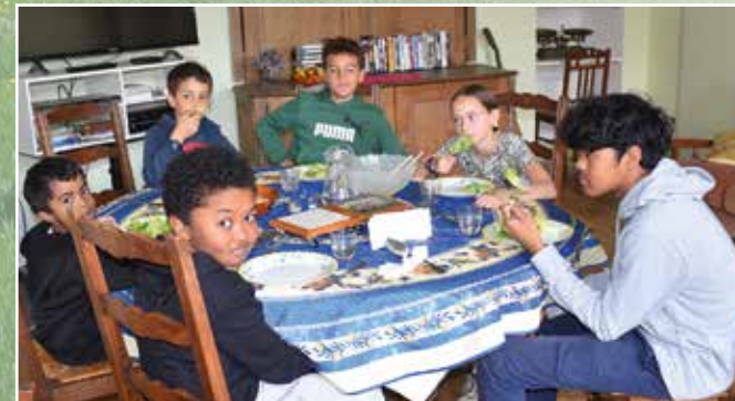
expérience de la fraternité