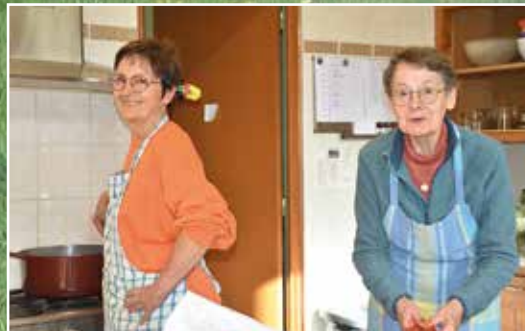
joie et harmonie dans le travail